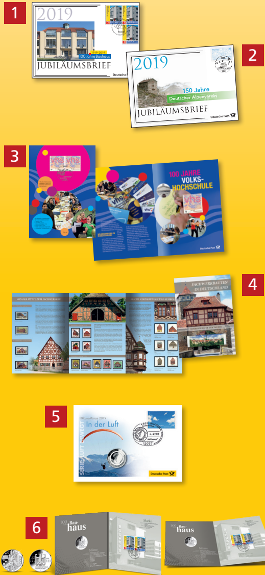
Alle Abb. Muster.