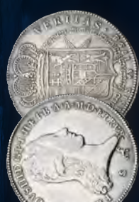
Toskana Francesco I. | 1795-1799 | 27,5 g Ø 41 mm | sehr schön/vorzüglich