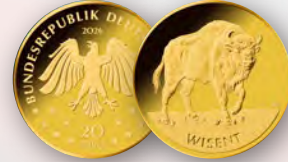
© BVA, Künstler: Jasmin Luis, Linsengerichte, Fotograf: Haris-Joachim Wuthenow, Berlin

Die sechsteilige Goldserie » Die Rückkehr der Wildtiere « zeigt seit 2022 Tiermotive bedrohter Arten, die bei uns wieder Fuß gefasst haben. Lieferung Jeder Ausgabe inkl. Briefmarkenblatt und Original-Echtheitszertifikat Serie »Rückkehr der Wildtiere« | Deutschland | 20 Euro | Gold (999/1000) | 3,89 g | Ø 17,5 mm | Stempelglanz