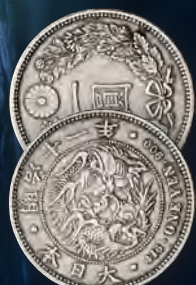
Japan 1 Yen | 1874-1912 | 26,9 g Ø 38,5 mm | sehr schön/vorzüglich

Diese fünf prächtigen Silbermünzen von stattlichem Format zirkulierten einst im internationalen Handel. Vom niederländischen Daaler der 19. Jahrhunderts bis zum japanischen Yen des 19. Jahrhunderts waren sie über Grenzen hinweg akzeptierte Zahlungsmittel.