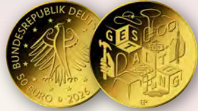
© BVA, Künstler: Bastian Prilwitz, Berlin, Fotograf: Haris-Joachim Wuthenow, Berlin

Die fünfteilige Serie » Deutsches Handwerk « setzt Handwerksberufen ein bleibendes Denkmal – als Symbol ihrer Bedeutung für unser tägliches Leben. Lieferung Jeder Ausgabe inkl. Briefmarkenblatt und Original-Echtheitszertifikat Serie »Deutsches Handwerk« | 50 Euro | Deutschland Gold (999/1000) | 7,78 g | Ø 22 mm | Stempelglanz