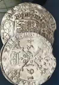
Spanische Niederlande Patagon | 1622-1667 | 27,27 g Ø 41 mm | sehr schön