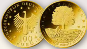
© BVA, Künstler: Martin Dášek, Staré Hradiště (Tschechien), Fotograf: H.-J. Wuthenow, Berlin

Die achtteilige 100-Euro-Serie » Meisterwerke der deutschen Literatur « würdigt große deutsche Dichter. Lieferung Jeder Ausgabe inkl. Briefmarkenblatt und Original-Echtheitszertifikat Serie »Meisterwerke der deutschen Literatur« | 100 Euro Deutschland | Gold (999/1000) | 15,5 g | Ø 28 mm | Stempelglanz