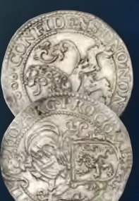
Niederlande 1 Daaler | 1575-1713 | 27,64 g Ø 40 mm | sehr schön