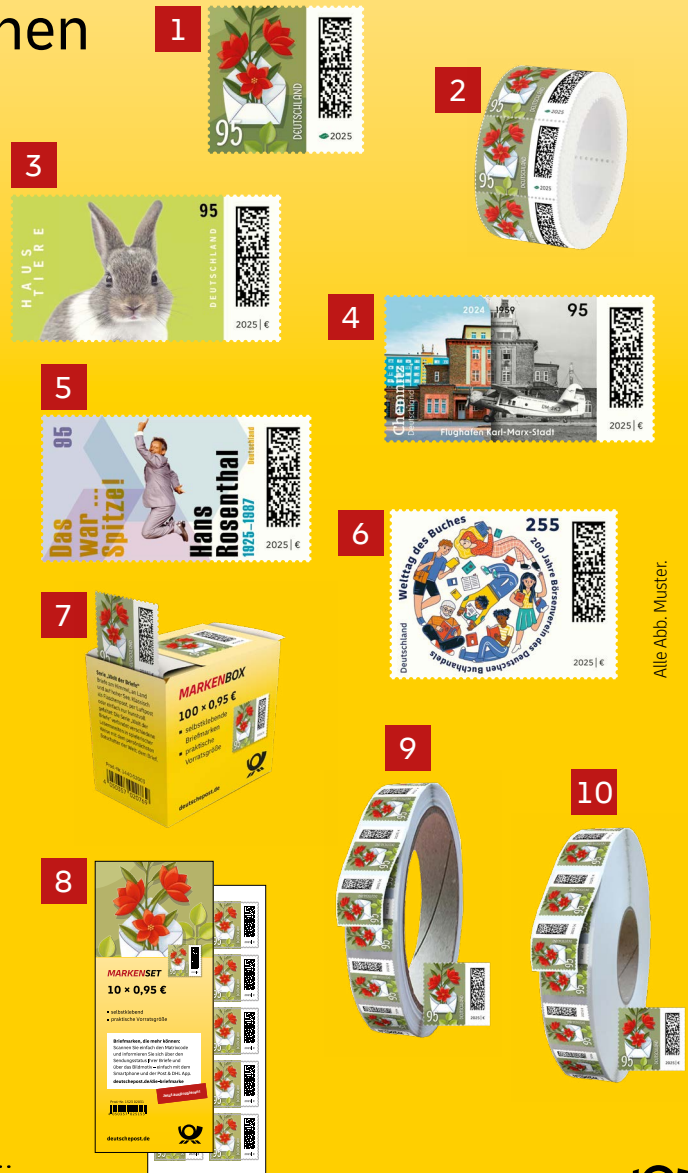
Alle Abb. Muster.