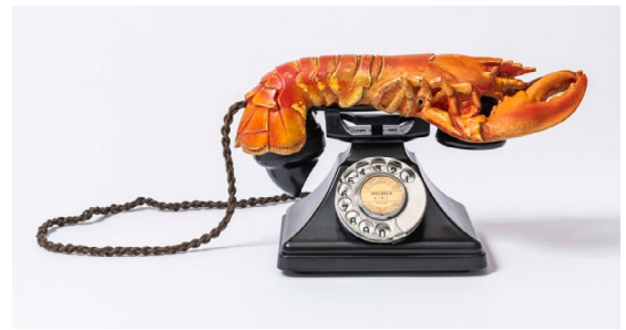
Motiv: „Aphrodisisches Telefon“ oder „Hummertelefon“ / © Salvador Dalí, Fundació Gala-Salvador Dalí / VG Bild-Kunst, Bonn 2024

Mediengeschichte(n) ... mit Kunst erzählt Mit der „Kunstspur“ wird Mediengeschichte durch Kunst neu erzählt. Die Räume folgen den Phänomenen der Dauerausstellung „Mediengeschichte(n) neu erzählt“: BESCHLEUNIGUNG, VERNETZUNG, KONTROLLE und TEILHABE – ergänzt durch digitale Kunstwerke und ausgewählte Porträts. Alle präsentierten Werke stammen aus der Sammlung der Museumsstiftung Post und Telekommunikation.