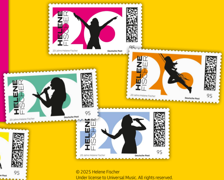
© 2025 Helene Fischer Under license to Universal Music. All rights reserved.

Ein Blick auf die verschiedenen Silhouetten genügt – und alles ist wieder da: Licht. Musik. Gänsehaut.