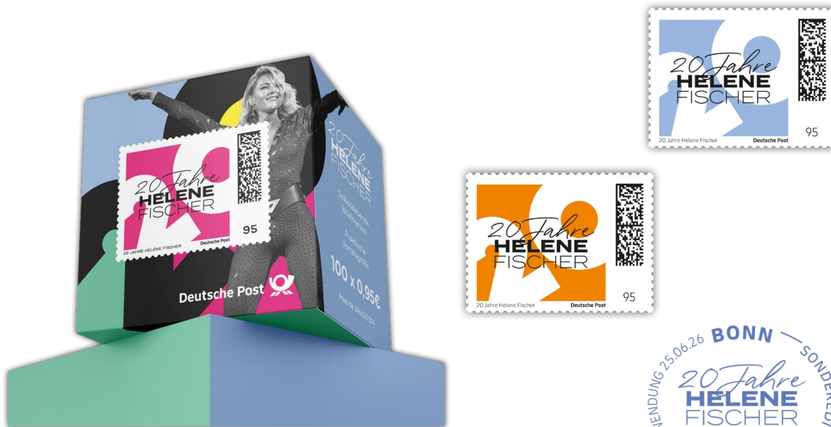
© 2025 Helene Fischer Under license to Universal Music. All rights reserved.